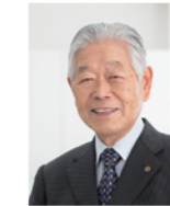
株式会社イワサキ経営 代表取締役会長 税理士法人イワサキ 代表社員