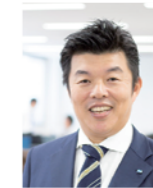
株式会社イワサキ経営 代表取締役社長

弊社では「社員第一」「顧客満足」「地域貢献」を経営理念に掲げています。私たちの事業は知識や情報の提供であり、社員なくしては成り立ちません。だからこそ、まず社員の幸せを追求することを大切にしています。社員一人ひとりの成長を促し、仕事と生活の充実に寄与することで、はじめてお客さまの満足、そして地域社会に貢献できると信じています。私たちはこれからも、静岡という地域に密着し、みなさまから頼りにされる存在であり続けたい、そう願っています。