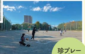
珍プレー 好プレー 連発！