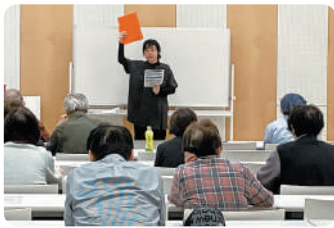
相続税セミナーの様子