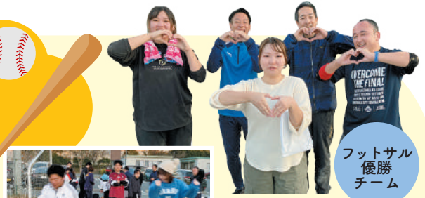
フットサル 優勝 チーム