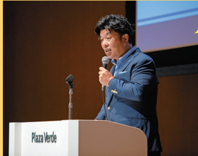
社員へ理念の大切さを伝える社長

コンパスは方角だけがわかっている。地図は道をすべて教えてくれる。理念がない場合、地図が行き止まりになったら進む道がわからなくなってしまう。しかし会社の考え方、目指すべきものを全員が持っていれば多少道が険しくても、そこに道が無くても、コンパスを使って会社の目指すべき場所に向かってどう進めばいいのか自ら考えて行動することができる。